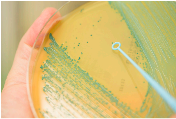
K90A7697 - HygieneAlimentaire - Boîte de Petrie avec listeria monocytogenes