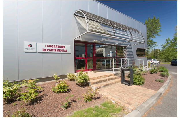
K90A7820 - LaboDep_Batiment - Photos extérieures du LDA33