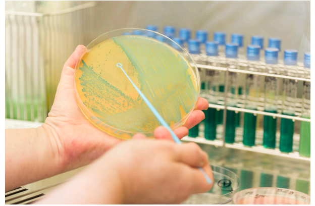
K90A7694 - HygieneAlimentaire - Boîte de Petrie avec listeria monocytogenes