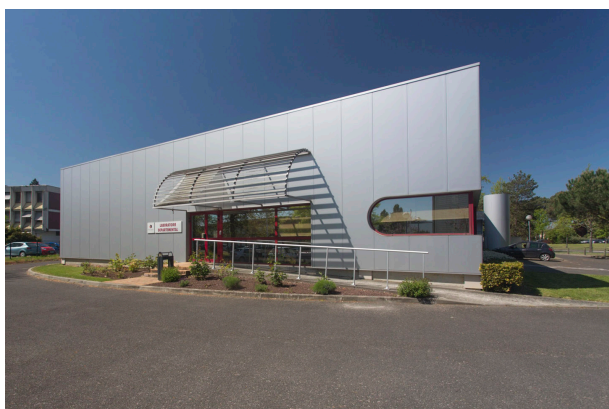
K90A7814 - LaboDep_Batiment - Photos extérieures du LDA33