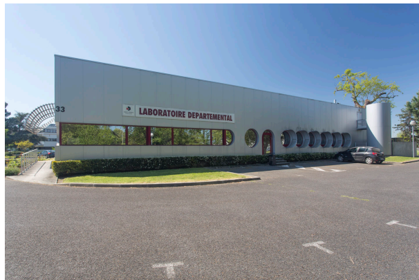
K90A7807 - LaboDep_Batiment - Photos extérieures du LDA33