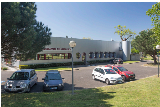
K90A7808 - LaboDep_Batiment - Photos extérieures du LDA33