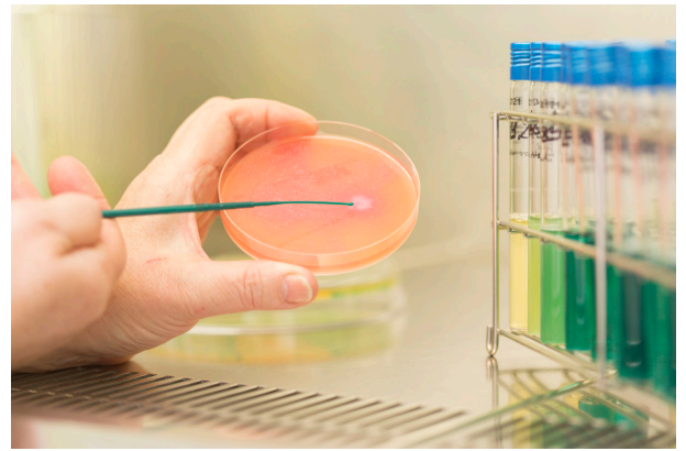
K90A7703 - HygieneAlimentaire - Boîte de Petrie avec Bacillus Cerclus