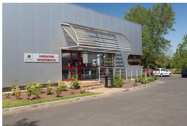
K90A7815 - LaboDep_Batiment - Photos extérieures du LDA33