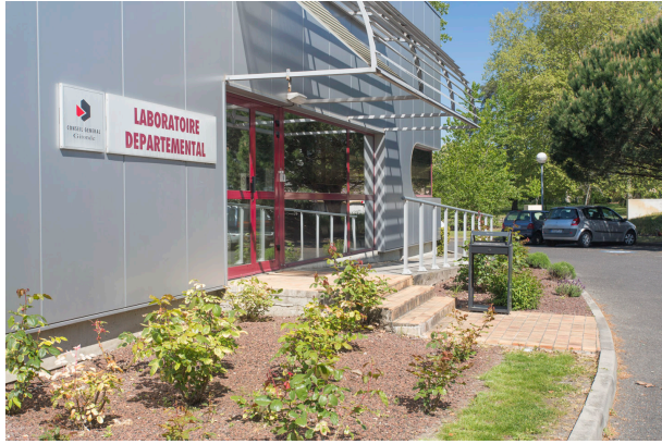
K90A7817 - LaboDep_Batiment - Photos extérieures du LDA33