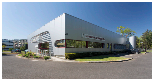
K90A7812 - LaboDep_Batiment - Photos extérieures du LDA33